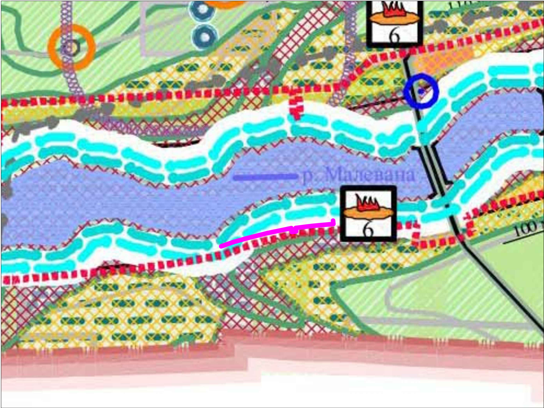
Карта существующих и планируемых зон с особыми условиями использования территории х. Казаче-Малеваного