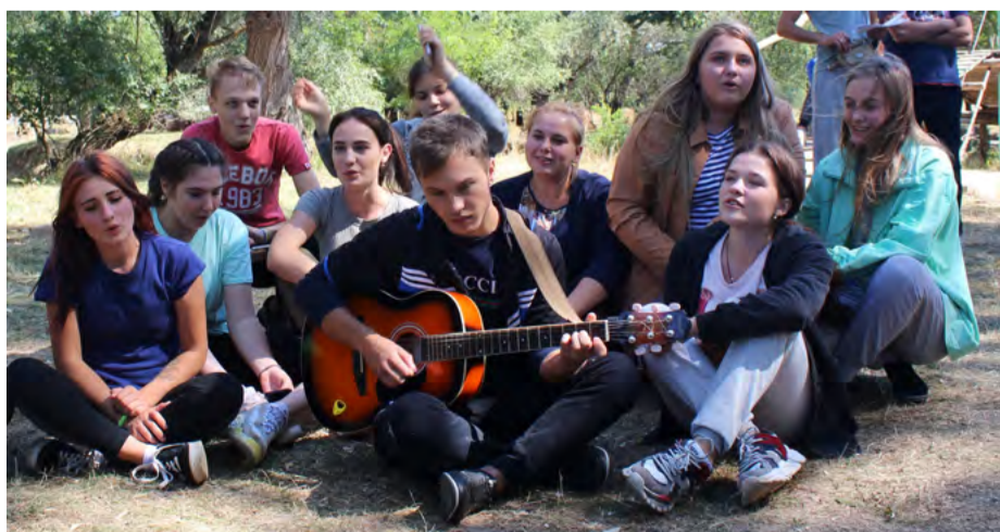
Песня под гитару